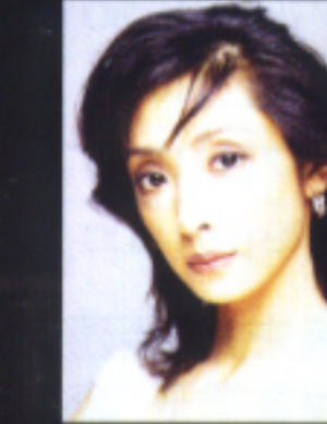
★金平糖の精★ 草刈民代 Tamiyo Kusakari